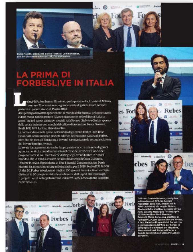
Articolo tratto dalla rivista FORBES del Gennaio 2018